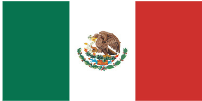
Emblema nacional de México