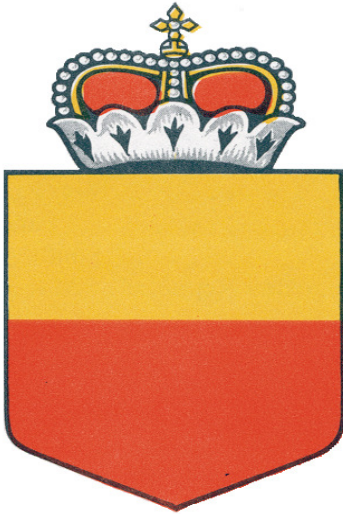
Emblema nacional de Liechtenstein

4. Emblemas nacionales utilizados junto con las marcas de nacionalidad