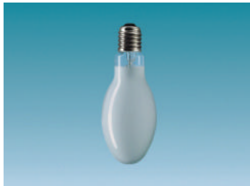
ITEM 5, 6, 7 y 8