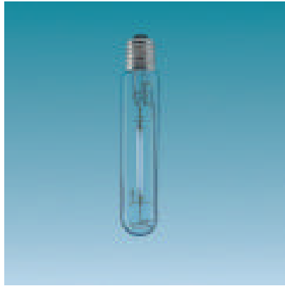
ITEM 9 y 10