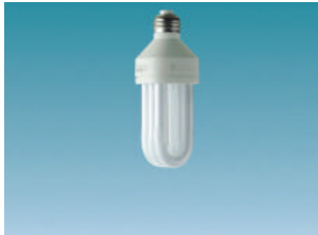
ITEM 14 y 15